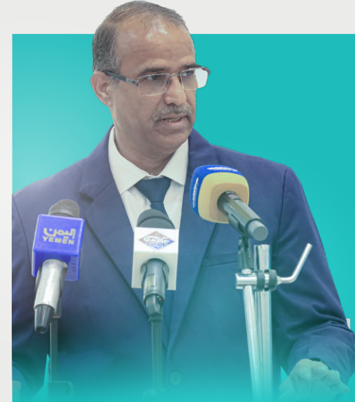
د . محمد سعيد الزعوري وزير الشؤون الاجتماعية والعمل

تحقيقاً للتعاون المشترك وأدوار وزارة الشؤون الاجتماعية والعمل في تمكين منظمات المجتمع المدني وخلق حراك تنموي نحو تحقيق أهداف التنمية المستدامة يسرنا أن نشارك في ملتقى استدامة لبناء قدرات منظمات المجتمع المدني الذي تنظمه مؤسسة التواصل للتنمية الإنسانية وبالتعاون مع مكتب تنسيق المساعدات الإنسانية التابع للأمم المتحدة ( أوتشا )، هذا الملتقى الهام سيساهم بدرجة كبيرة في تعزيز قدرات الجمعيات والمؤسسات المشاركة وتبادل الخبرات ومواجهة التحديات التنموية الرئيسية، حيث يقع على عاتقها اليوم مسؤولية الانتقال من