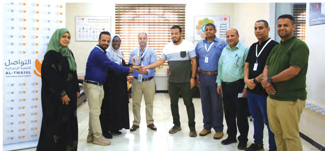
زيارة المنسق الوطني لكتلة الإيواء في الأوتشا للمؤسسة