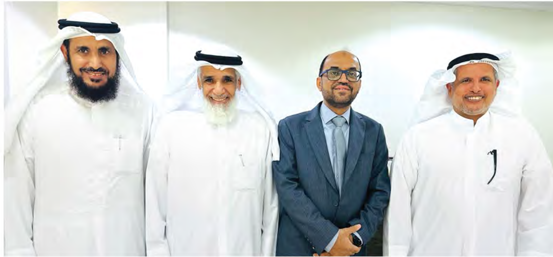
مع مدير عام جمعية الرحمة العالمية بدولة الكويت ونائبه لقطاع البرامج والمشاريع ورئيس مكتب اليمن