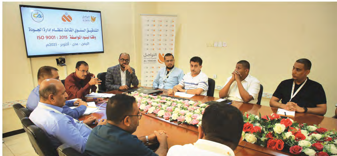
التدقيق الخارجي على نظام إدارة الجودة وفقاً لبنود المواصفة ISO 9001:2015