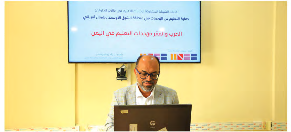
رئيس المؤسسة في لقاء الشبكة المشتركة لوكالات التعليم في حالة الطوارئ