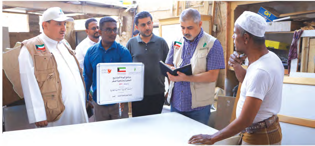
أثناء تقييم أحد المشروعات من قبل وفد الهيئة الخيرية الإسلامية العالمية