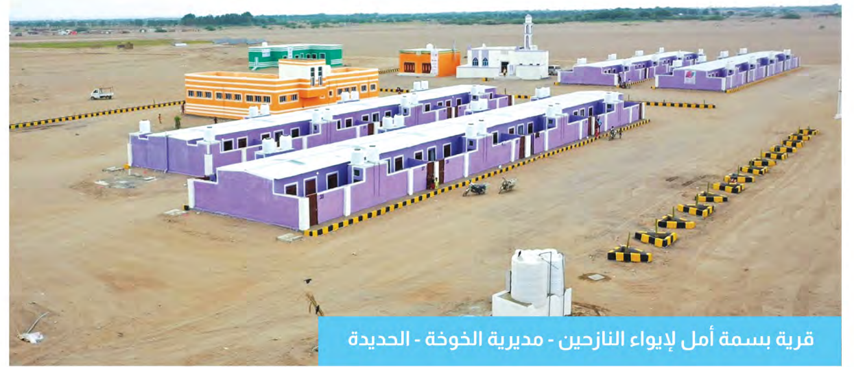
قرية بسمة أمل لإيواء النازحين - مديرية الخوخة - الحديدة