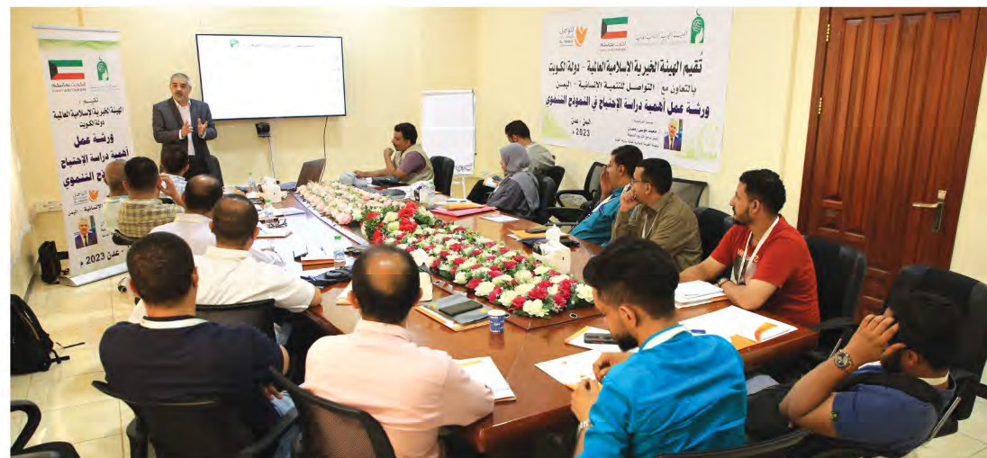
جانب من الدورة التدريبية (أهمية دراسة الإحتياج في النموذج التنموي)