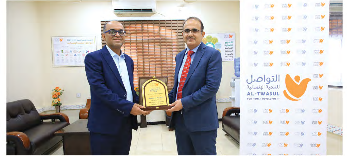
وزير الصحة العامة والسكان خلال زيارته لمؤسسة التواصل