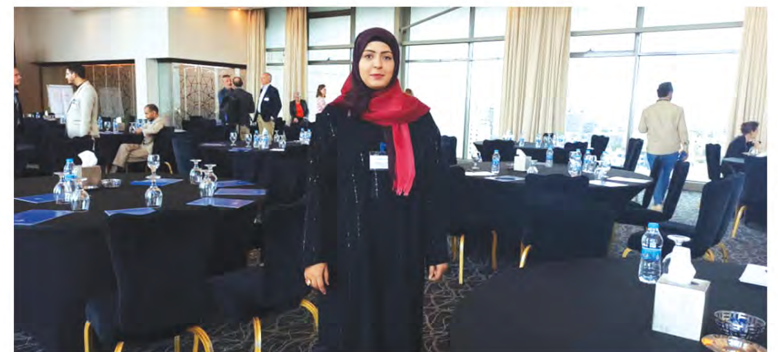
بتنظيم من بعثة الإتحاد الأوربي مشاركة المؤسسة في الورشة الخامسة لكبار المسؤولين الإنسانيين - الأردن