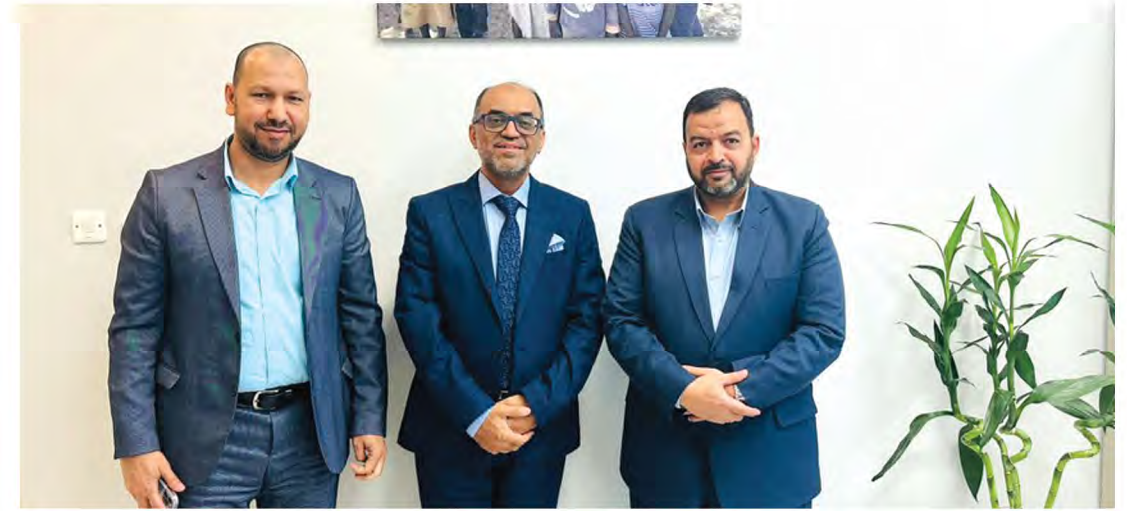
الرئيس التنفيذي للتواصل للتنمية الإنسانية مع مدير المشاريع ونائبه بجمعية الشيخ عبدالله النوري الخيرية- دولة الكويت