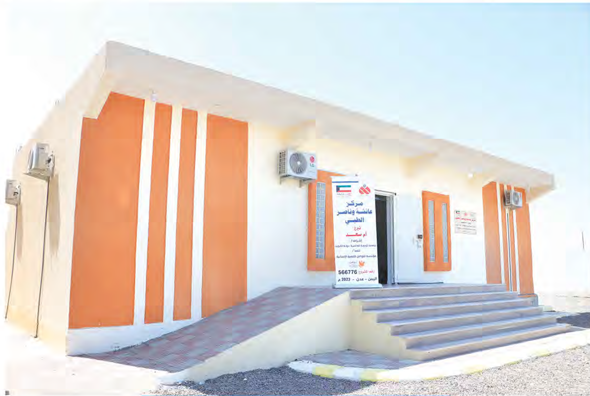
مركز عائشة وناصر الطبي - عدن