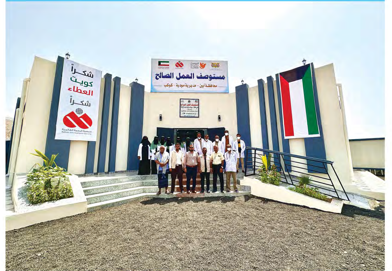
مستوصف العمل الصالح - أبين