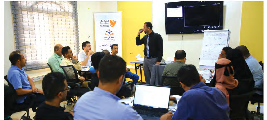
البرنامج التدريبي إحترافية المشاريع PMP