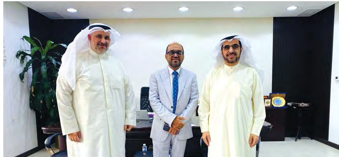
مع مدير عام الهيئة الخيرية الإسلامية العالمية ونائبه بدولة الكويت