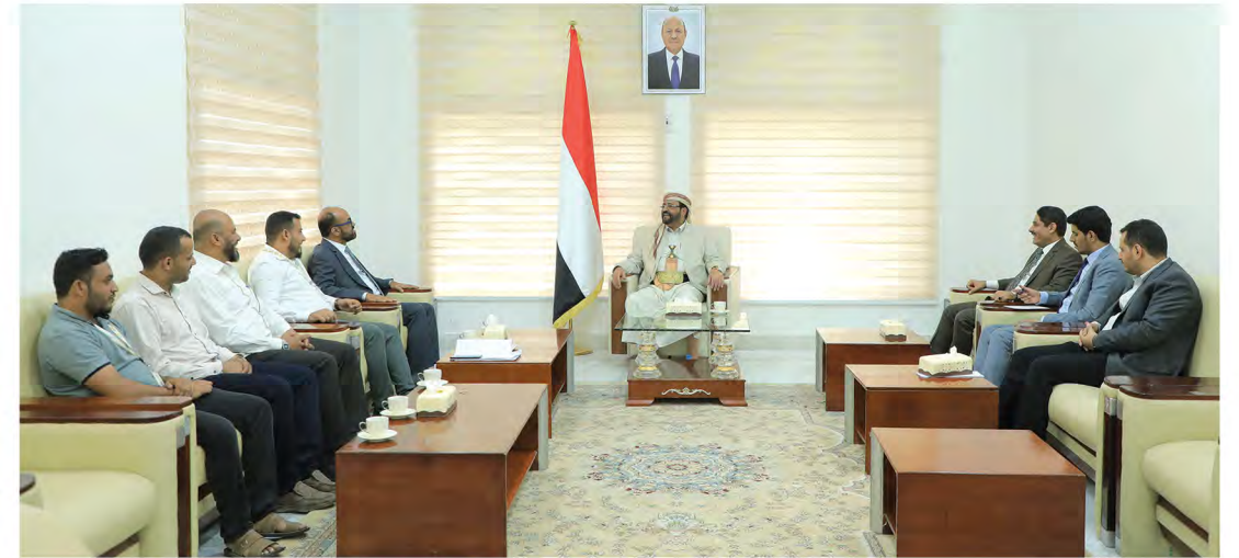
وقد مؤسسة التواصل أثناء لقائه بنائب رئيس مجلس القيادة الرئاسي محافظ محافظة مأرب اللواء / سلطان بن علي العرادة