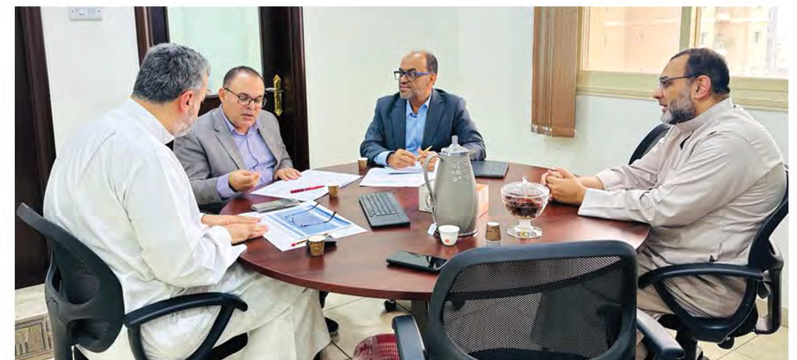
مناقشة معايير وضوابط تنفيذ المشروعات مع إدارة الدراسات بجمعية الرحمة العالمية.