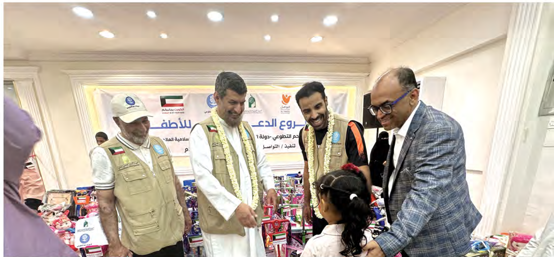
زيارة وفد من فريق تراحم التطوعي التابع للهيئة الخيرية الإسلامية العالمية لليمن