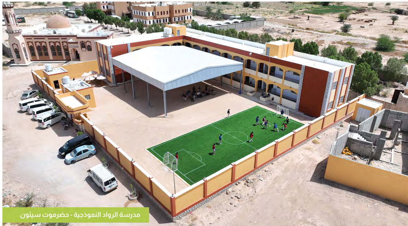
مدرسة الرواد النموذجية - حضرموت سينون