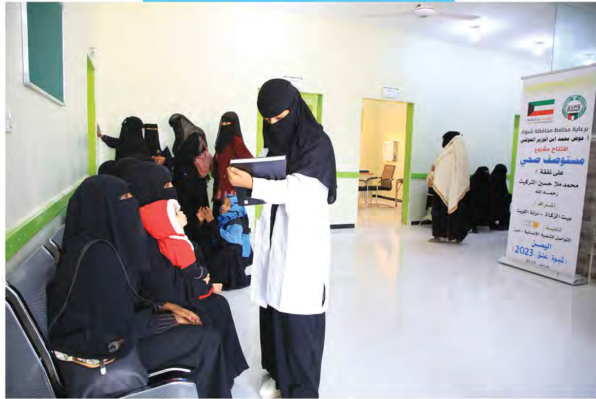
افتتاح مركز التركيت الطبي - شبوة