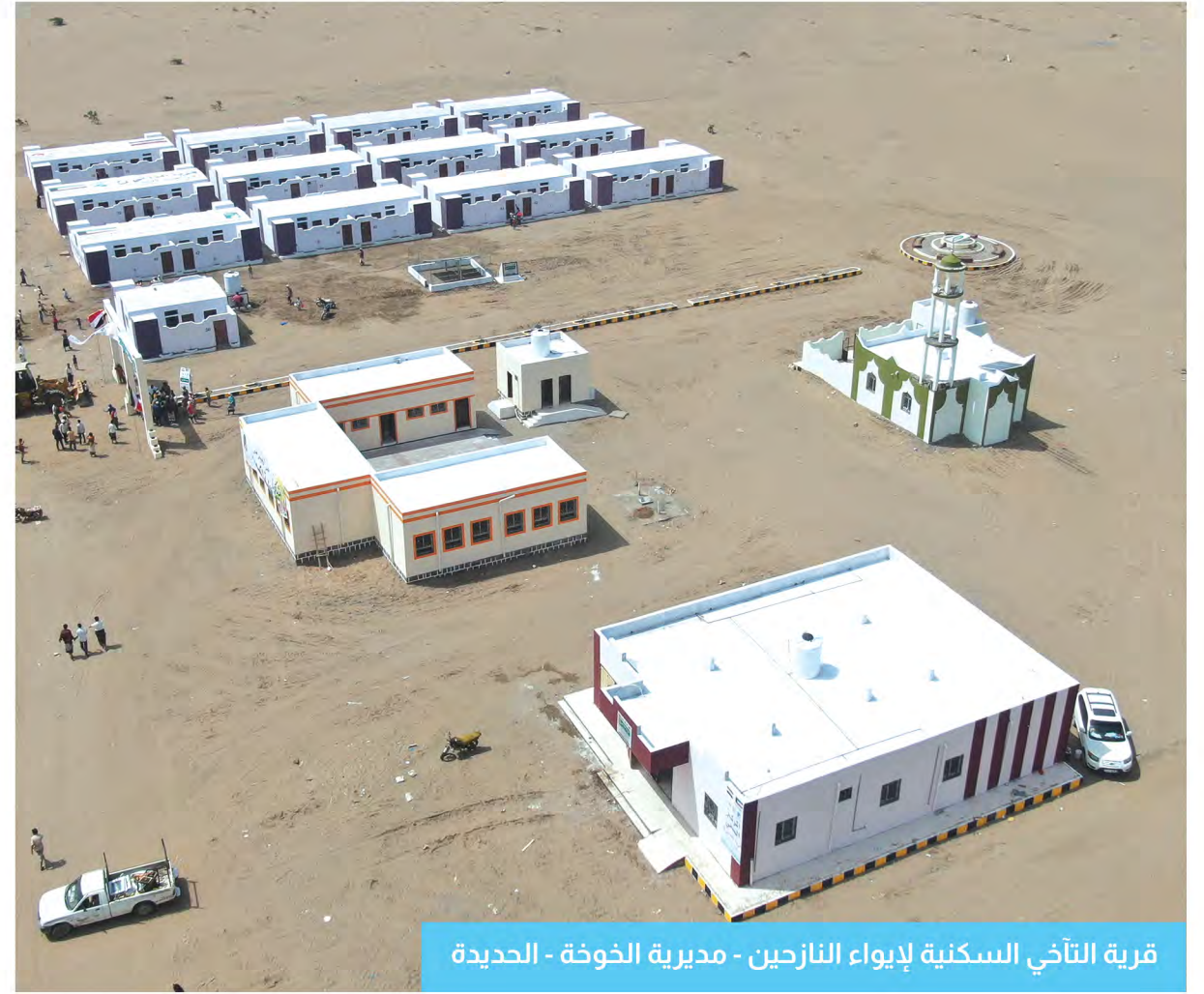
قرية التآخي السكنية لإيواء النازحين - مديرية الخوخة - الحديدة