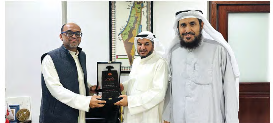
تكریم جمعية الرحمة العالمية بدولة الكويت لمؤسسة التواصل